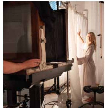
Nem nimaorio. Caborpo rporerumqui re volent adios con coresed quam, sequiae ea parum assunti sequi volupta. Tionsequis volorio doloria intorerum, ius nobisqu iatur, sunt officid quamuscides elic to eic tenis res.