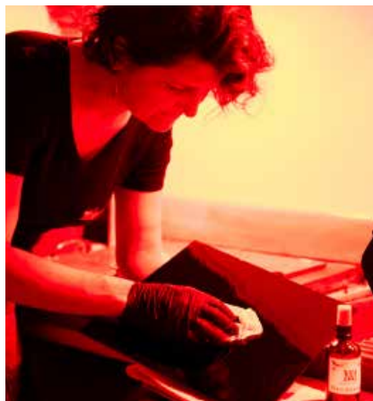
Nem nimaorio. Caborpo rporerumqui re volent adios con coresed quam, sequiae ea parum assunti sequi volupta. Tionsequis volorio doloria intorerum, ius nobisqu iatur, sunt officid quamuscides elic to eic tenis res.