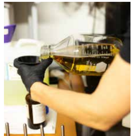
Nem nimaorio. Caborpo rporerumqui re volent adios con coresed quam, sequiae ea parum assunti sequi volupta. Tionsequis volorio doloria intorerum, ius nobisqu iatur, sunt officid quamuscides elic to eic tenis res.