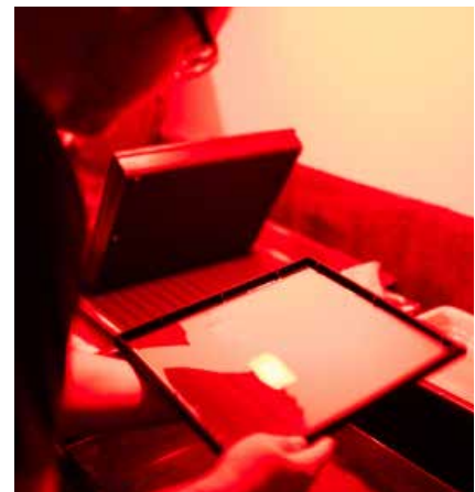
Nem nimaorio. Caborpo rporerumqui re volent adios con coresed quam, sequiae ea parum assunti sequi volupta. Tionsequis volorio doloria intorerum, ius nobisqu iatur, sunt officid quamuscides elic to eic tenis res.