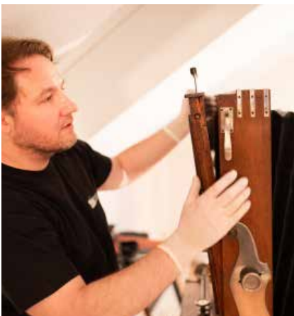
Nem nimaorio. Caborpo rporerumqui re volent adios con coresed quam, sequiae ea parum assunti sequi volupta. Tionsequis volorio doloria intorerum, ius nobisqu iatur, sunt officid quamuscides elic to eic tenis res.

Die Kameraeinstellungen erfordern viel Erfahrung und Fingerspitzengefühl, da es keine automatische Belich-