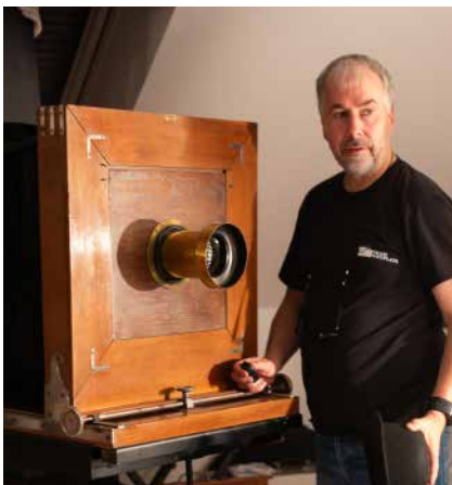
Nem nimaorio. Caborpo rporerumqui re volent adios con coresed quam, sequiae ea parum assunti sequi volupta. Tionsequis volorio doloria intorerum, ius nobisqu iatur, sunt officid quamuscides elic to eic tenis res.

Was uns besonders fasziniert, ist die Unvorhersehbarkeit und Einzigartigkeit jeder Aufnahme. Kein Bild gleicht dem anderen und diese Individualität spiegelt für uns die Einzigartigkeit jedes Menschen wider. Die entstehenden Bilder üben durch ihre Materialien und ihre Anmutung eine große Faszination auf uns