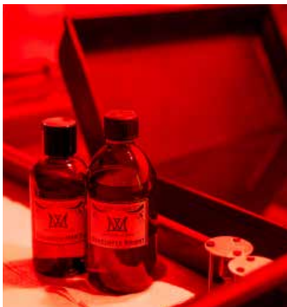
Nem nimaorio. Caborpo rporerumqui re volent adios con coresed quam, sequiae ea parum assunti sequi volupta. Tionsequis volorio doloria intorerum, ius nobisqu iatur, sunt officid quamuscides elic to eic tenis res.